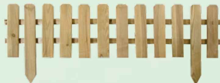
Recinzione bassa in pino impregnato 120x45/30cm