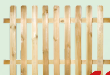
Staccionata legno trattamento autoclave MAREMMA 180x90