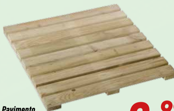
Pavimento legno impregnato piastrella singola 50x50