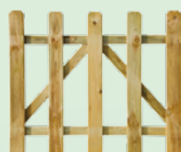
Cancello legno trattamento autoclave MAREMMA 100x90