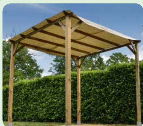
Pergola Mt. 3x3 Struttura in legno impregnato Pali cm 9x9x240