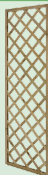
Griglia rettangolare 60x180 cornice 30x35mm listelli 8x30 mm foro 9 cm.