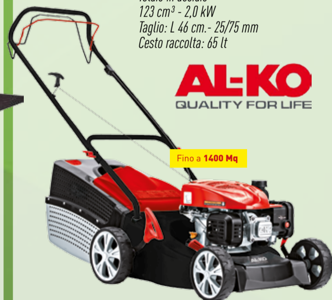
Tosaerba CLASSIC 4.66 SP-A Telaio in acciaio 123 cm 3 - 2,0 kW Taglio: L 46 cm. - 25/75 mm Cesto raccolta: 65 Lt