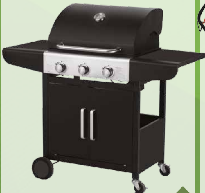
Bbq a gas 3 fuochi, coperchio con termometro, carrello con tasche, 2 ruote, ripiano