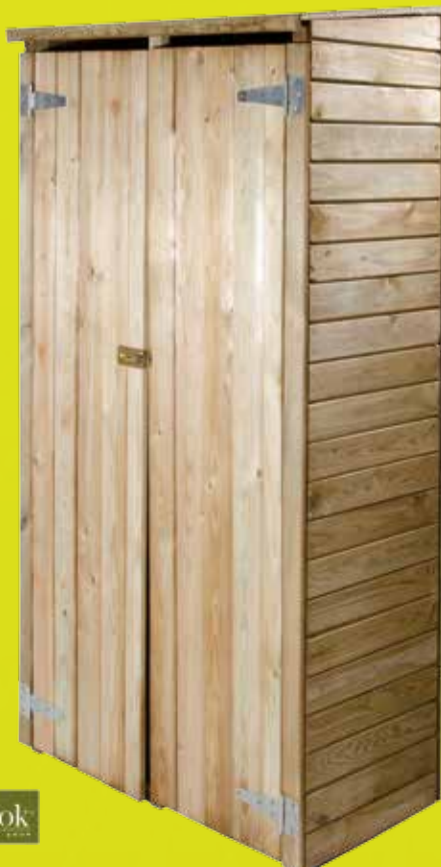
Armadio Small Legno impregnato. Ripiani interni e chiavistello di chiusura. Dimensioni: base 85x46xH177 cm. Guaina grigia