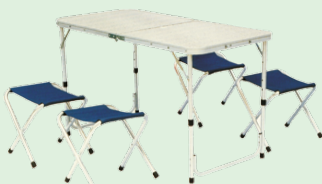
Tavolo camping* pieghevole in alluminio e laminato misura 60 x 120 x 70h + 4 sgabelli alluminio e poliestere