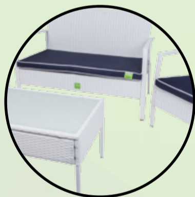
Set TREND grigio in polyrattan divano+tavolo+2 poltrone disponibile anche bianco