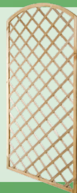
Griglia arco 90x180cm cornice 35x35mm, listelli 8x30mm foro 9cm

disponibile anche: cm 100x200 o 120x180 € 24,90